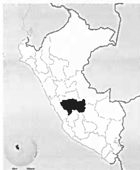
Figura N°01: Ubicación geográfica de la provincia de Huancayo, ubicada en el departamento de Junín